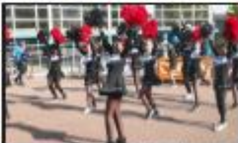
Après la victoire de l'homme à la barbe, vainqueur de la course, c'est ce qui a accompagné la victoire de l'homme à la barbe, vainqueur de la course.