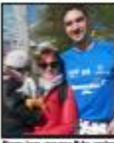
Après la victoire de l'homme à la barbe, vainqueur de la course, c'est ce qui a accompagné la victoire de l'homme à la barbe, vainqueur de la course.