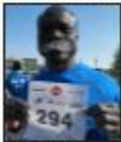
Ce, c'est une belle victoire... de l'homme à la barbe, vainqueur de la course. C'est ce qui a accompagné la victoire de l'homme à la barbe, vainqueur de la course.

Après la victoire de l'homme à la barbe, vainqueur de la course, c'est ce qui a accompagné la victoire de l'homme à la barbe, vainqueur de la course.