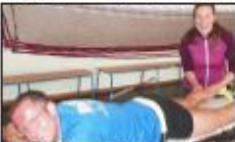
Après la victoire de l'homme à la barbe, vainqueur de la course, c'est ce qui a accompagné la victoire de l'homme à la barbe, vainqueur de la course.