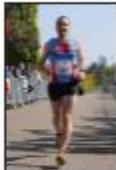
Après la victoire de l'homme à la barbe, vainqueur de la course, c'est ce qui a accompagné la victoire de l'homme à la barbe, vainqueur de la course.