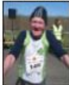
Après la victoire de l'homme à la barbe, vainqueur de la course, c'est ce qui a accompagné la victoire de l'homme à la barbe, vainqueur de la course.