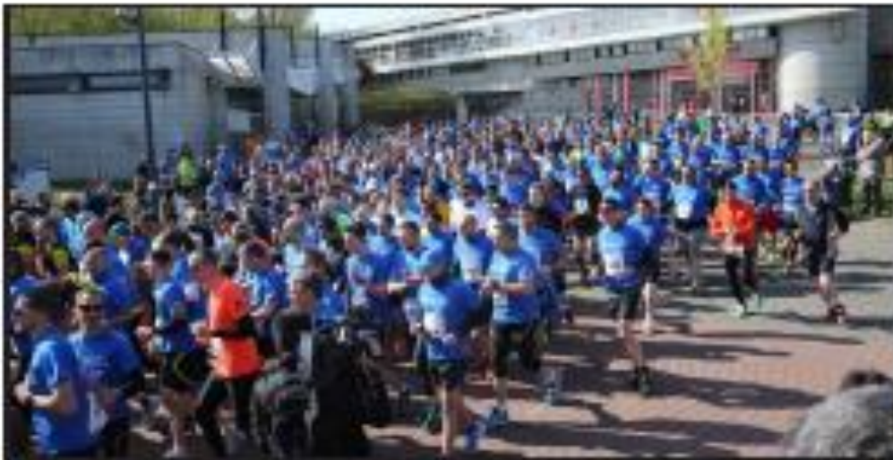
Plus de 500 participants ont pris part à la course à thème masculin de l'Hommes Run.